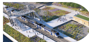
CRÉATION DES QUAIS TER

L'actuelle gare de Nice Saint-Augustin sera déplacée sans aucune interruption de service au niveau du nouveau Pôle d'Échanges Multimodal.