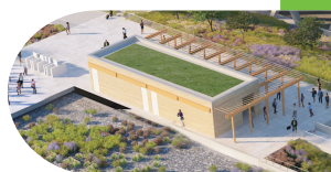
TRAVAUX BÂTIMENT VOYAGEURS (OUVERTURE À L'ÉTÉ 2022)