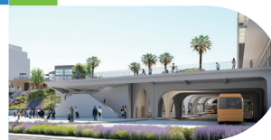
AMÉNAGEMENT ESPLANADE SUR GARE ROUTIÈRE

Une large esplanade entièrement équipée accueillera les voyageurs. Lieu de transition, de convivialité et de rencontres, elle constitue également le toit de la gare routière, pour une architecture plus esthétique et une maîtrise de la pollution sonore.