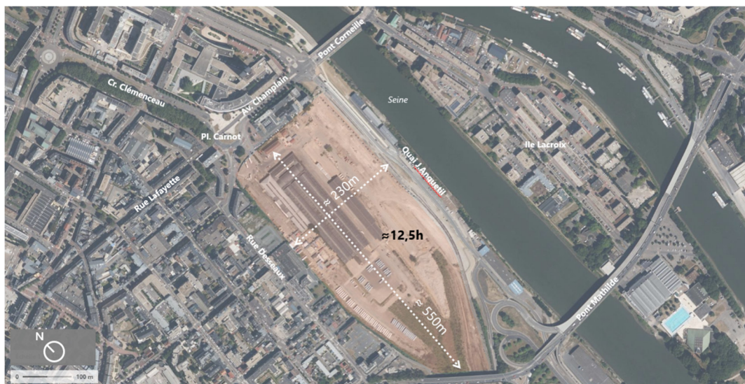
Périmètre de projet - emprise SNCF - AREP 2023

Le site est aujourd'hui en grande partie mis à nu, à l'exception d'une halle en son centre (le reste des anciennes halles furent démolies en 2023) et d'une petite partie occupée en équipements transitoires, Le Quartier Libre.