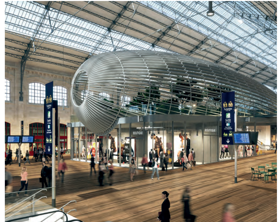
Grande halle voyageurs – Paris Austerlitz

Le projet de modernisation de la gare est intégré à un projet plus global de rénovation urbaine pour lequel SNCF Gares & Connexions, Kaufman & Broad, ALTAREA, Indigo et Elogie-SIEMP travaillent de concert et en interface jusqu'à la livraison en 2027.