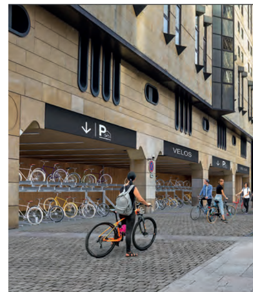
Futur parking à vélo – côté Seine de la gare de Lyon

En rénovant son patrimoine, en modernisant ses gares et en les transformant en pôles de mobilités, SNCF Gares & Connexions souhaite donner « envie de gare » et contribue activement au report modal vers le ferroviaire.