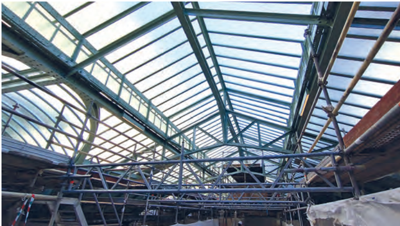
Rénovation de la verrière gare de Lyon