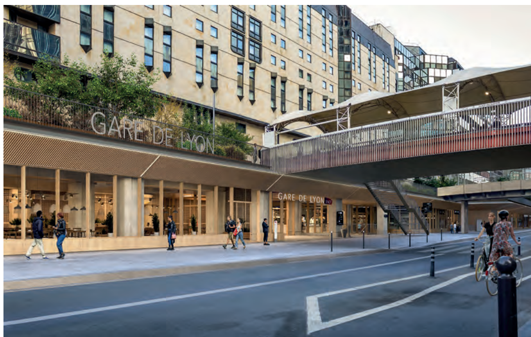
Futur côté Seine de la gare de Lyon – rue de Bercy