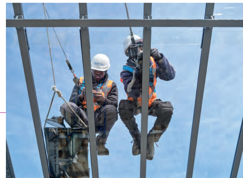
Pose des plaques de verre - verrière de Paris Austerlitz