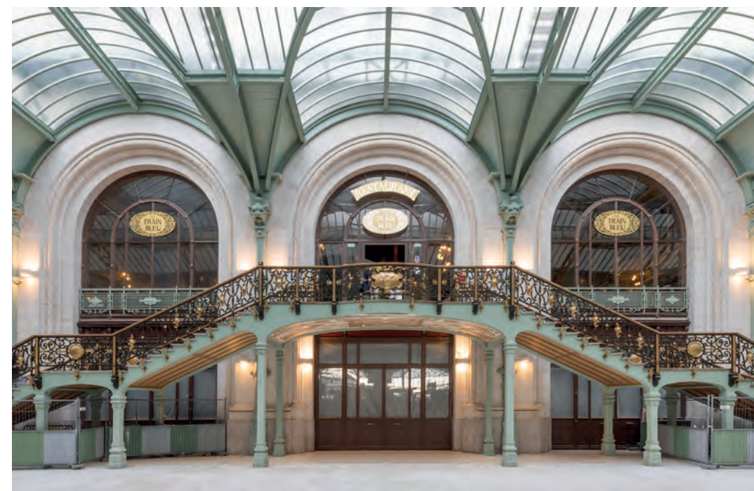
La devanture du restaurant « Le Train Bleu » - Hall 1