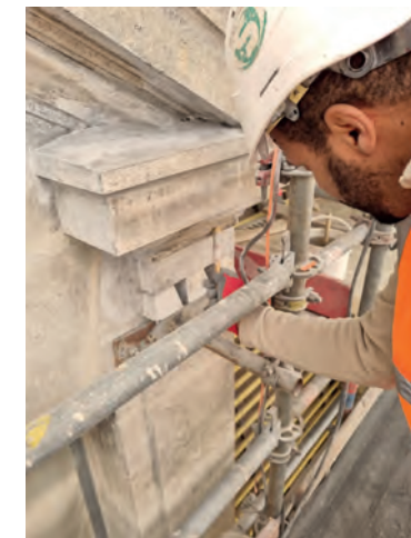
Des compagnons (tailleurs de pierre) restaurant les façades historiques de la gare de Lyon