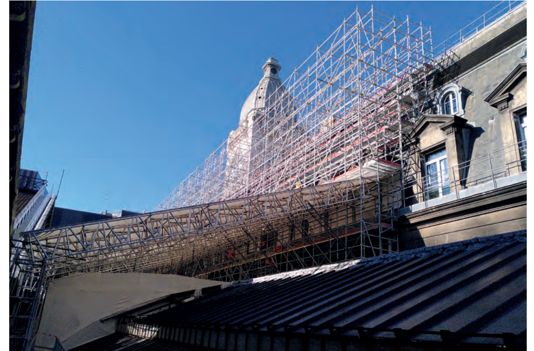
Montage de l'échafaudage gare de Lyon