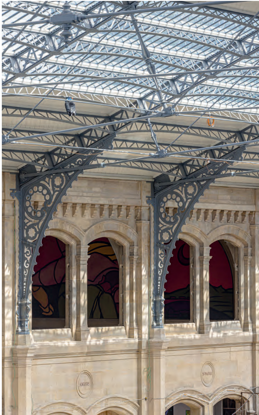
Rénovation de la façade historique et de la charpente métallique – Paris Austerlitz