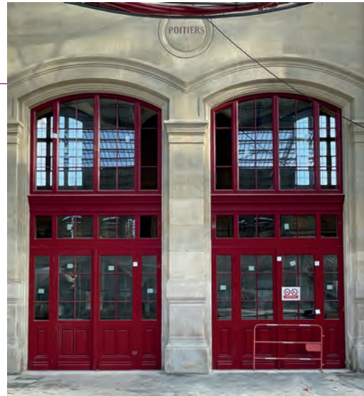
Menuiseries de la gare d'Austerlitz restaurées