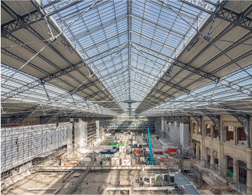
Sous la verrière rénovée de la gare d'Austerlitz