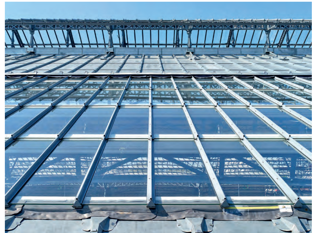
Verrière rénovée de la gare d'Austerlitz

L'expertise de SNCF Gares & Connexions est de préserver son patrimoine tout en transformant les gares pour les adapter aux enjeux de mobilité de demain, avec une place centrale accordée à l'intermodalité, à l'accessibilité et à l'offre de services.