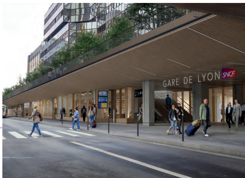
Réaménagement sous la dalle – côté Seine de la gare de Lyon

À plus long terme, la modernisation des halls 2 et 3 de la gare est à l'étude afin notamment d'améliorer l'accueil et le confort des voyageurs.