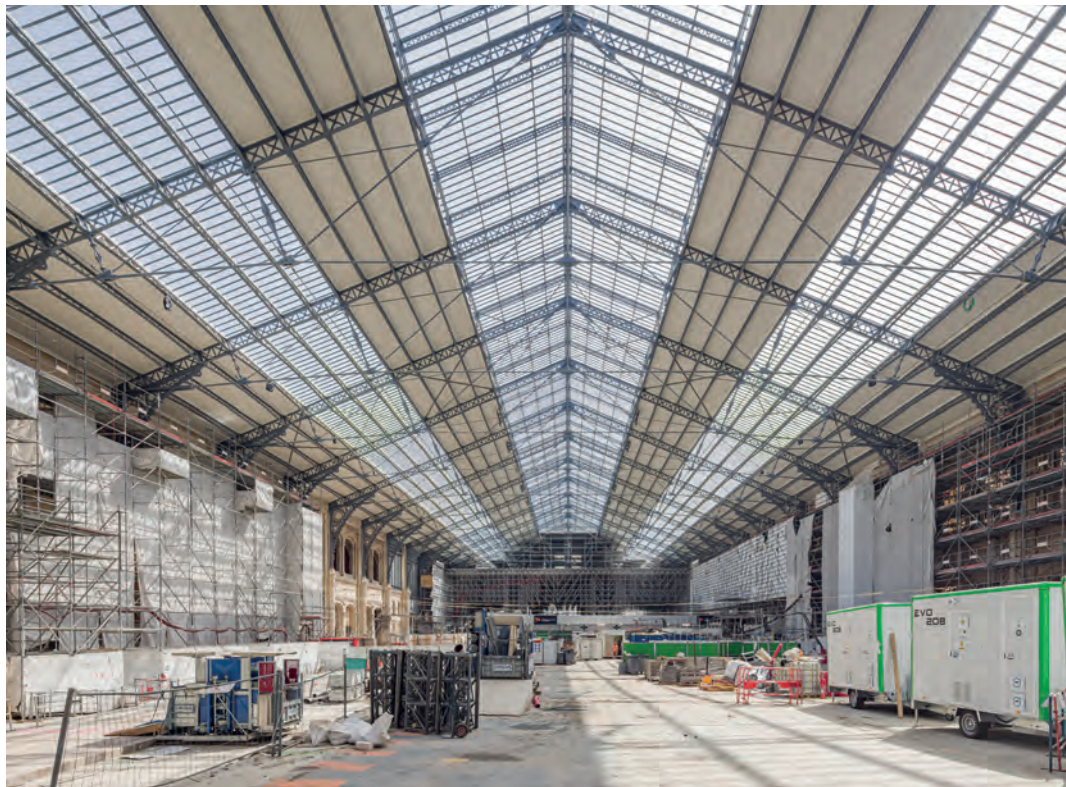
Grande halle voyageurs de Paris Austerlitz rénovée