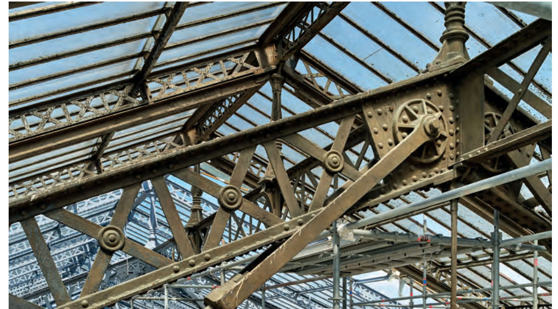
Grande halle voyageurs de Paris Austerlitz :