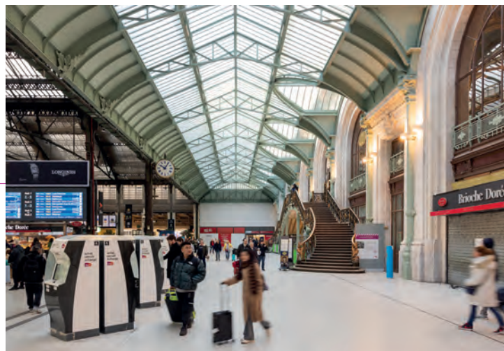
Hall 1 gare de Lyon