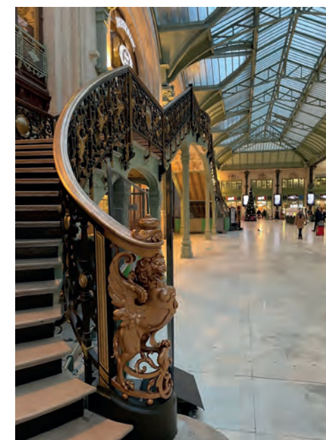
Chimère restaurée, escalier du restaurant « Le Train Bleu »