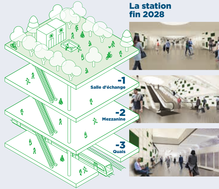
La station fin 2028

Véritable pôle d'échanges , cette station terminus accueillera un parking relais, une gare bus, 150 places de stationnements pour vélo (100 places à accès réglementé et 50 places sur parvis) et une aire de dépose/reprise en plus de la connexion avec le train en proximité immédiate.