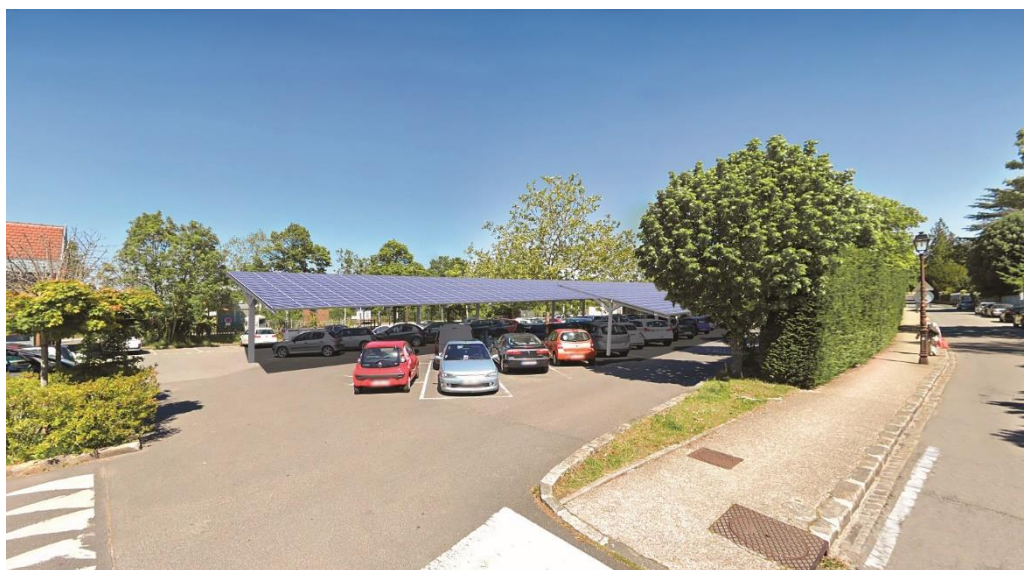
Futur parking de la gare de Louveciennes (Ile-de-France)