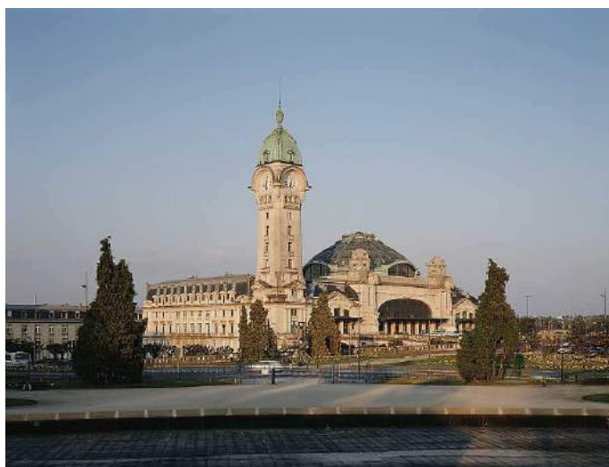
© Gare de Limoges Bénédictins – Mathieu Lee Vigneau

Le document de référence des gares peut faire l'objet de mises à jour (notamment modification de la liste des gares en raison d'ouverture ou de fermeture de gares). Ces mises à jour sont réputées entrer en vigueur après que SNCF / Gares & Connexions les a rendues publiques par tout moyen approprié. En outre, à l'exception des corrections d'erreurs matérielles et des mises à jour, SNCF / Gares & Connexions soumet les projets de modification du présent document aux parties intéressées.