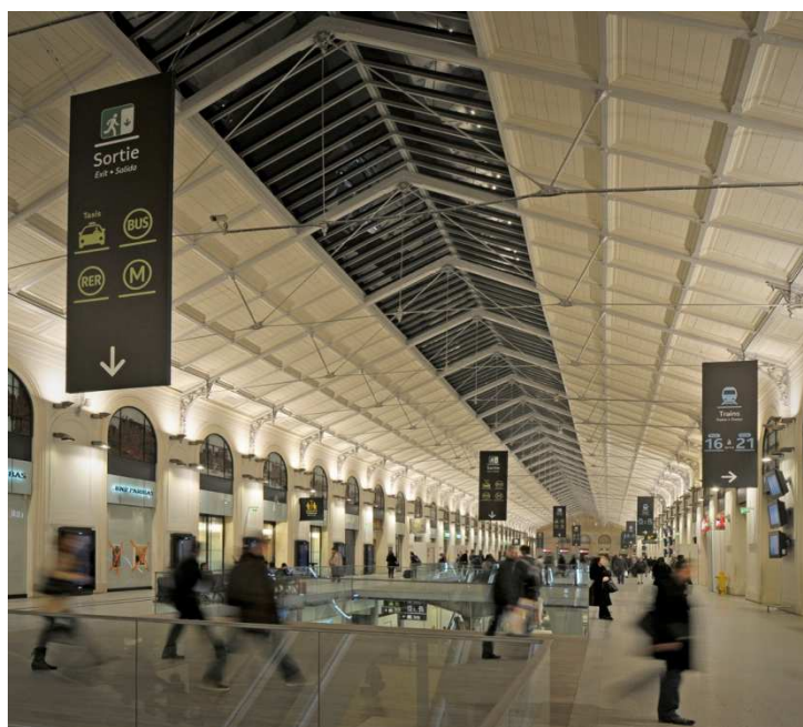
© Gare de Paris Saint-Lazare – Mathieu Lee Vigneau

En 2012, les produits bruts de cession se sont élevés à environ 6,2M€ pour une trentaine d'opérations. Après paiement le cas échéant de l'impôt sur les plus values immobilières, ces produits de cession alimentent la capacité d'autofinancement de la branche et contribuent ainsi au financement des investissements repris au point 6.A.